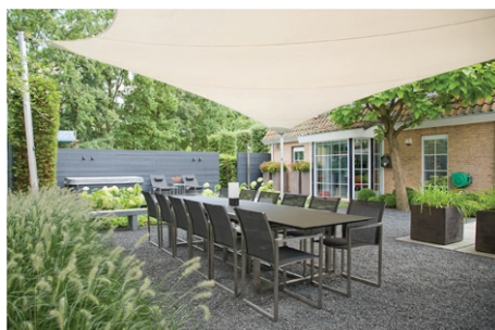
woonkamer zonder dak