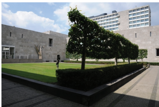
De binnentuin van de RK Economische Hogeschool Tilburg