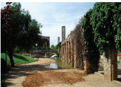
parkplein in Barcelona