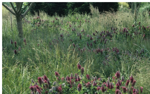
alpenweide als inspiratie