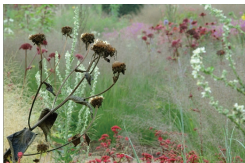
"dode planten, ook zo'n hobby van me"