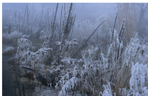
ook in de winter mooi

... is een ontwerper met een fascinatie voor planten. Zijn ontwerpen zijn eenvoudig, de beplanting vormt het belangrijkste bestanddeel van de tuin. Hij werkt graag met grassen, die hij zo inzet dat de tuinen ook in de winter weelderig blijven.