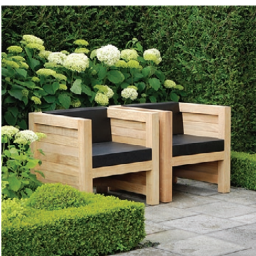
meteen al mooi