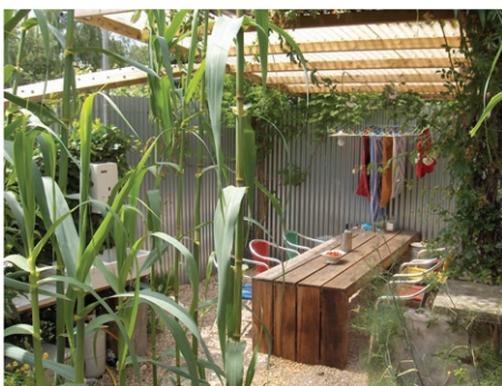
was drogen in de tuin