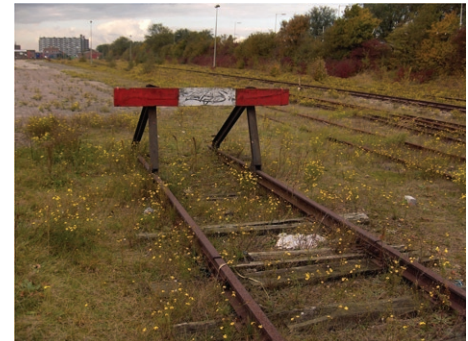
de kracht van natuur

“Vroeger werden de tuinen veel meer gebruikt als nutstuinen. De was moest er drogen en lag te bleken op het gras. Mensen werkten in hun tuin, hadden er kippen en groente. Nu willen mensen genieten in hun tuin [...] Wij juichen het toe als de was wordt gedroogd in de tuin. Wij zien dat ook als een beeldend element [...] [...] Wij proberen de diversiteit aan materialen in een compositie te vatten. De veedrinkbak als bad, en de geiser staat bewust in een met witte tegeltjes beplakte nisje. Ons meubilair is ‘objectmatig meubilair’. Het vervangt een sculptuur, het is een toepassing van kunst in de tuin.[...] Een ‘catwalk’, dat is een pad van rijplaten gedragen door knotwilgen. Rijplaten vinden wij mooi. Dat is doorleefd, daar hebben tien- en twintigtonners overheen gereden. Het is getekend materiaal.”